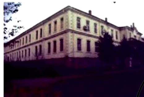
Şemsi Efendi İlkokulu