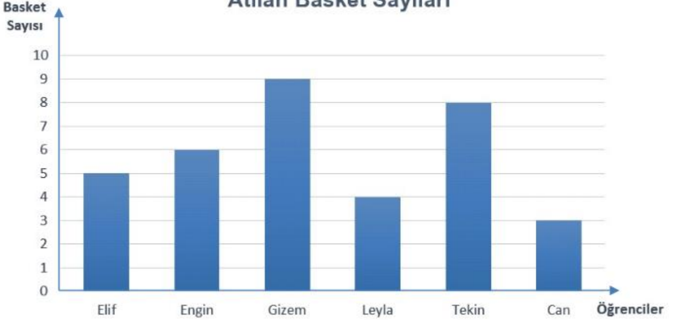
Grafik: Beden Eğitimi Dersinde Atılan Basket Sayıları

1. Öğrenciler toplam kaç basket atmıştır?